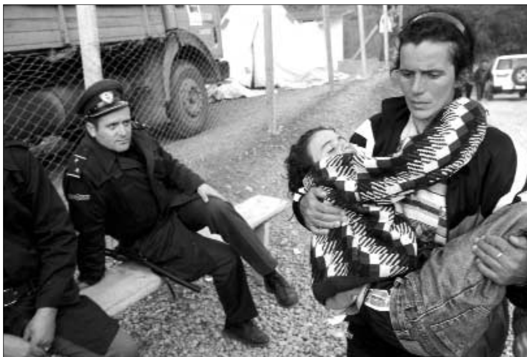
Una mujer albanesa de Kosovo lleva en brazos a su hija, que se había desmayado junto a la carretera, mientras entra al campo de refugiados de Radusha, en Macedonia, organizado por la OTAN y controlado por la policía y el ejército de Macedonia, abril de 1999. Durante todo ese año, miles de personas huyeron de sus hogares en Kosovo para escapar de la violencia étnica y los bombardeos de la OTAN.

utilizados por los combatientes, o en los campos de desmovilización establecidos en el periodo posterior al conflicto. El colapso total de la atención médica primaria en el contexto de un conflicto afecta a las mujeres de forma diferente, y a menudo desproporcionada, debido a sus particulares necesidades de salud y responsabilidades como cuidadoras.