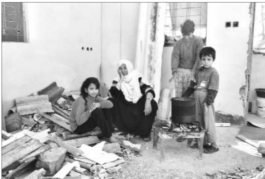
Familia de Rafah (franja de Gaza), sentada en los restos de su casa, gravemente dañada por las fuerzas israelíes. El ejército y las fuerzas de seguridad israelíes han destruido más de 3.000 viviendas, grandes extensiones de tierras de cultivo y cientos de bienes más en los Territorios Ocupados de Cisjordania y Gaza desde septiembre de 2000.

tras que a las mujeres se las considera sólo víctimas ocasionales y «colaterales». Debido a estos supuestos, las historias de las mujeres rara vez tienen cabida en la historia de los conflictos. Los medios de comunicación casi nunca exponen en profundidad la totalidad de las complejas dimensiones de la experiencia que ellas viven. Y, lo que es crucial, las voces de las mujeres casi siempre han quedado excluidas de los procesos de resolución del conflicto y reconstrucción tras él.