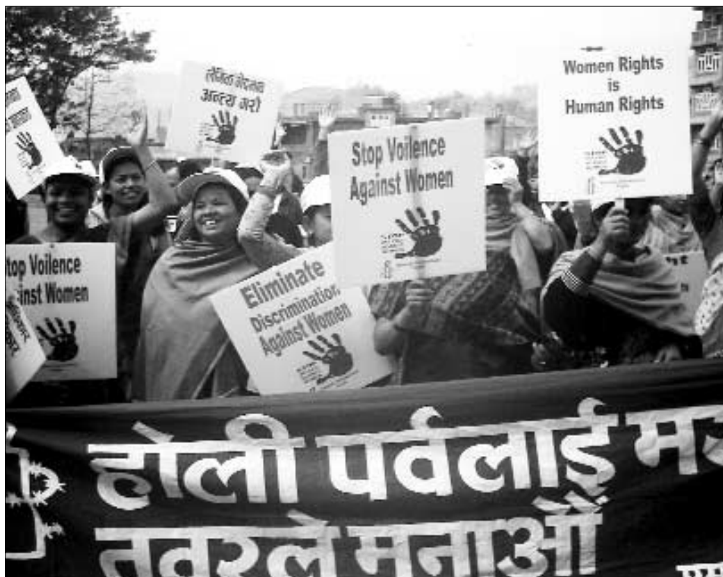
Participantes de la concentración de presentación de la Campaña para Combatir la Violencia contra las Mujeres organizada por la Sección Nepalí de Amnistía Internacional en Banepa, cerca de Katmandú, marzo de 2004. Además de la membresía de Amnistía Internacional, participaron mujeres activistas de otras organizaciones no gubernamentales.

establecer la estructura de la cadena de mando de estos grupos, que quizá no reconozcan ninguna obligación en virtud del derecho internacional humanitario. Puede que no existan mecanismos judiciales para hacer que los perpetradores comparezcan ante la justicia con arreglo a las normas de imparcialidad procesal, especialmente en zonas controladas por grupos armados.