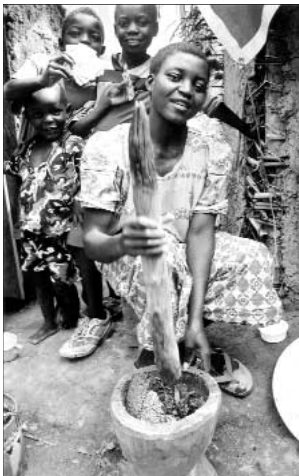
Una mujer prepara la comida en un campo para desplazados de Erengeti, República Democrática del Congo, en julio de 2003. Miles de mujeres de la región oriental del país se han visto obligadas a huir de sus hogares por miedo a perder la vida o ser violadas.

La mayoría de los perpetradores eran miembros de la milicia respaldada por el gobierno, los yanyawid, pero un número creciente de datos indicaba que también estaban implicados soldados gubernamentales. Ni siquiera estaban a salvo las mujeres que llegaban a los campos de refugiados. Sólo en marzo de 2004 la ONU supo que en el campo para desplazados internos de Mornei, Darfur Occidental, eran violadas hasta 16 mujeres al día cuando salían a recoger agua. Las mujeres tenían que ir al río: sus familias necesitaban el agua y temían que, si salían los hombres, fueran asesinados. 2