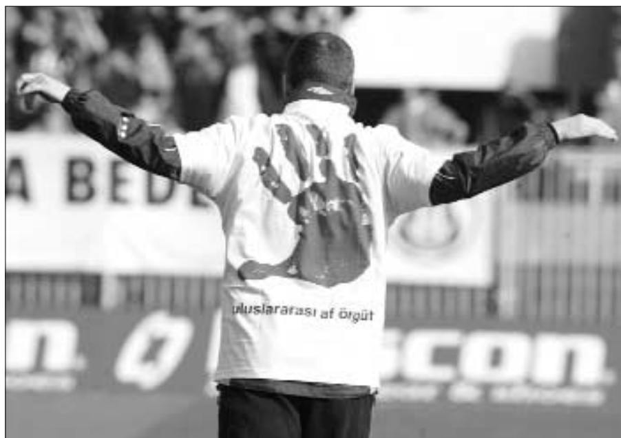
Jugador del partido de fútbol celebrado en Turquía en el que ambos equipos llevaron camisetas donde se leía «No más violencia contra las mujeres», febrero de 2004. La parte delantera de las camisetas llevaba el lema «Tarjeta roja para la violencia contra las mujeres».

a diario desde zonas de guerra de todo el mundo, nadie puede alegar que no sabe lo que pasa. Nadie puede ocultarse tampoco tras la excusa de que no se puede hacer nada. Es urgente encontrar formas de acción más eficaces, proporcionales a la escala y la gravedad de los crímenes que se cometen.