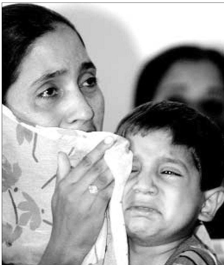
Una mujer sostiene en brazos a su hijo mientras presta declaración en una vista pública en Nueva Delhi, India, en abril de 2002. Ella presenció cómo una mujer de su familia era violada y quemada viva durante la violencia entre comunidades que estalló en Gujarat en febrero de 2002.

ción de la vergüenza y el estigma que tan a menudo se asocia a la violación y de ser elegidas como blanco de nuevos ataques por sus agresores o por otras personas, las reglas permitían el uso de pseudónimos y la distorsión electrónica de las voces y de las imágenes fotográficas y acordaban que las transcripciones podían revisarse para eliminar toda referencia a las identidades de las víctimas. 101