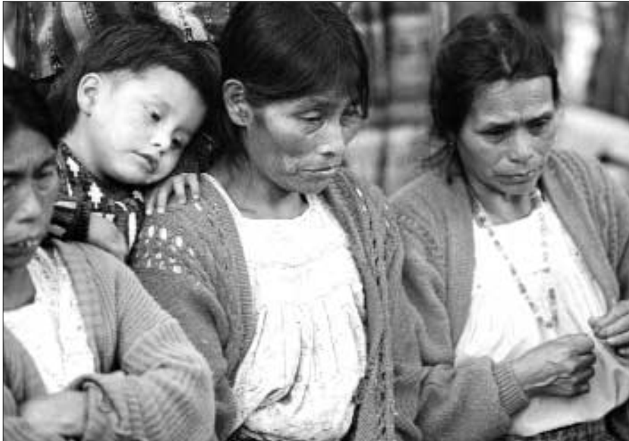
Los familiares lloran la muerte de sus seres queridos en una ceremonia maya celebrada en Guatemala tras la exhumación de los restos de las víctimas del conflicto armado, en 1997. Las mujeres han desempeñado un papel fundamental en la lucha por la verdad y la justicia tras décadas de conflicto en Guatemala.

versal. Deben promulgar leyes que permitan que las personas que cometan genocidio, crímenes de guerra y crímenes de lesa humanidad –incluidos y especialmente los crímenes contra las mujeres– puedan ser llevadas ante la justicia en cualquier tribunal, incluso fuera del país donde tuvieron lugar los crímenes. Amnistía Internacional hace campaña para que se lleven a cabo investigaciones inmediatas, eficaces, independientes e imparciales sobre los abusos cometidos en situaciones de conflicto armado. También lleva a cabo acciones de captación de apoyos junto con otras organizaciones no gubernamentales para asegurar que los Estados que salen de conflictos establecen de nuevo sus sistemas judiciales, de manera que puedan realizarse investigaciones y los autores sean puestos a disposición judicial en juicios con las debidas garantías. 110 Al igual que en la Corte Penal Internacional y en los tribunales especiales internacionales, las penas impuestas por los tribunales nacionales deben excluir la pena de muerte.