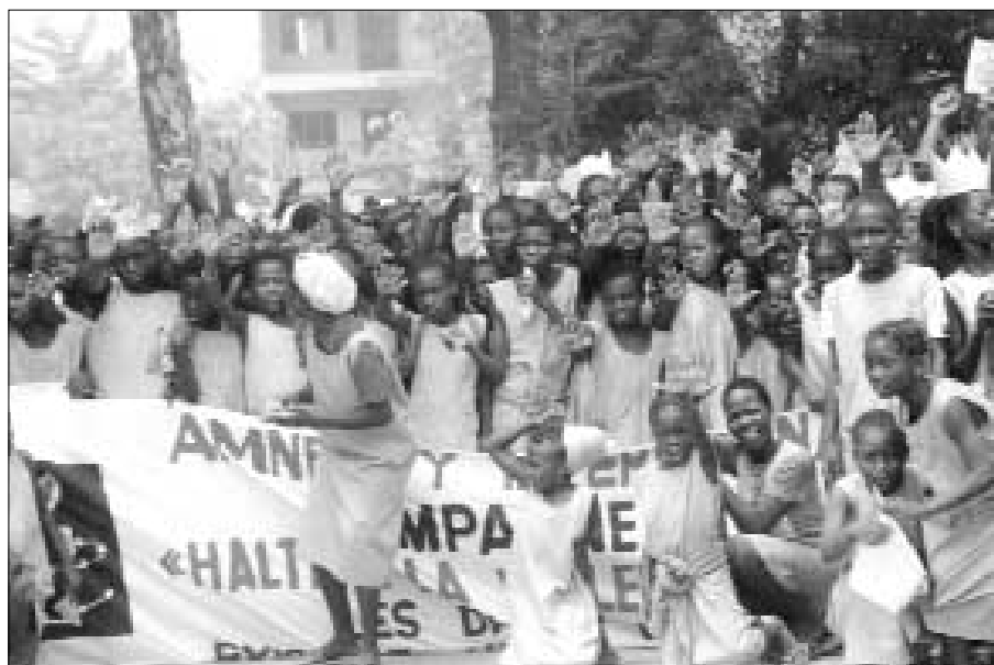
Colegialas participan en la presentación de la Campaña para Combatir la Violencia contra las Mujeres que la Sección Beninesa de AI organizó en Porto Novo, Benín, en 2004.

boletín del secretario general de la ONU sobre medidas especiales para la protección frente a abusos sexuales y explotación sexual ( Special measures for protection from sexual abuse and sexual exploitation ) y asegurándose de que las disposiciones de este documento se observan en la práctica.